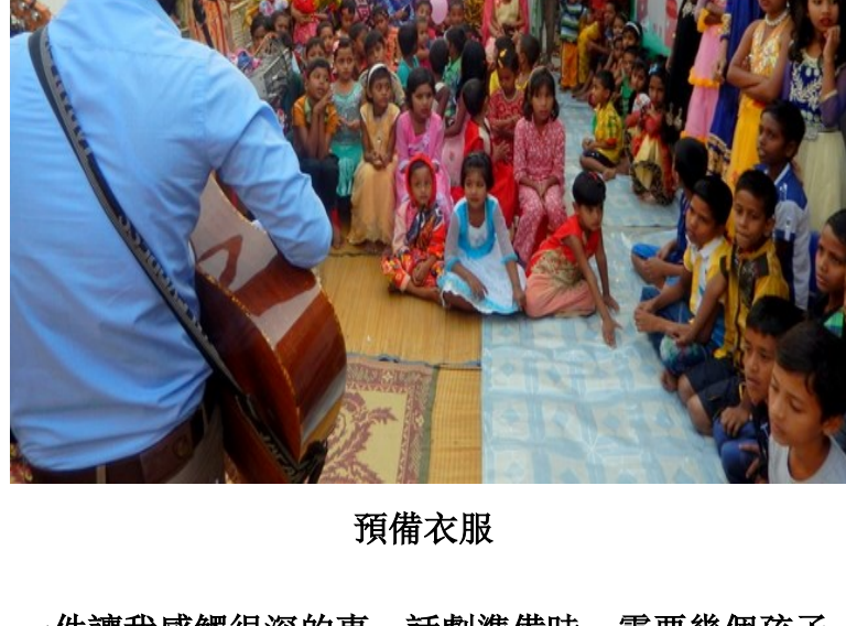
3-4 噸的物資送去香蕉城給有需要的貧民