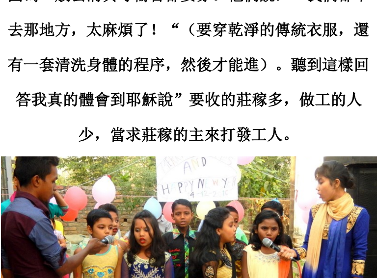
水城 貧民區兒童中心的聖誕活動

兒童中心有 70 個孩子。聖誕期間，安排孩子們唱歌，舞蹈，話劇，邀請他們的父母來參加，有 150 多人一起過聖誕。用浪子的故事向他們分享福音。孩子們過了一個愉快的聖誕節，家長們也欣慰於自己孩子的成長。