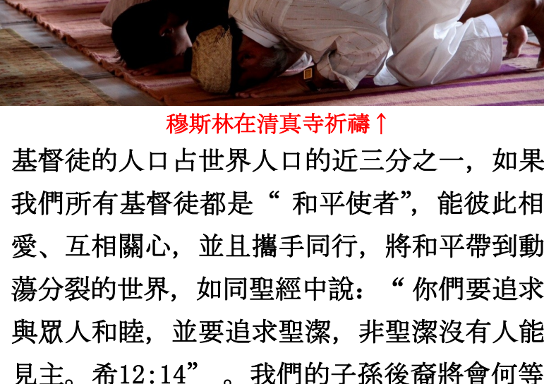
穆斯林在清真寺祈禱↑

基督徒的人口占世界人口的近三分之一，如果我們所有基督徒都是“和平使者”，能彼此相愛、互相關心，並且攜手同行，將和平帶到動蕩分裂的世界，如同聖經中說：“你們要追求與眾人和睦，並要追求聖潔，非聖潔沒有人能見主。希12:14”。我們的子孫後裔將會何等蒙福！