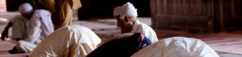
李老師和穆斯林交流↑

橋梁李老師一次在清真寺中，被一群穆斯林領袖詢問：“你是誰？你的信仰是什麼？”李老師回答：“我是中國人，是基督教新教徒。我曾經是“黑幫分子”和“搶劫犯”，但現在我的身份是牧師，因為耶穌改變了我的生命。我還是兩個孩子的父親。穆斯林和基督徒有很多不同： 文化、膚色、國籍 …但我們也有很多的相同點，特別是一樣的關愛家人、熱愛國家……我們中國的基督徒還沒有完全按照上帝的吩咐去愛穆斯林鄰居，但是我們想遵行祂的教導，所以我想請求你們——幫助我愛你們！”