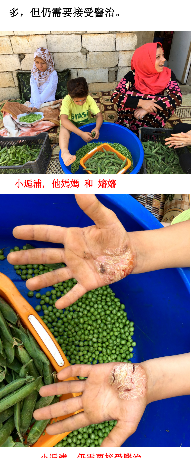
阿信仍需要第二次的手術