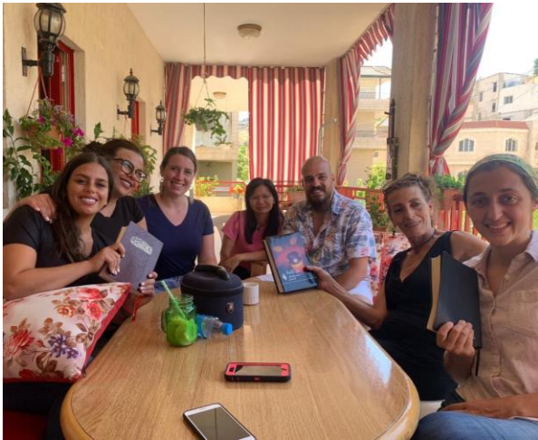
同工家庭圣经学习