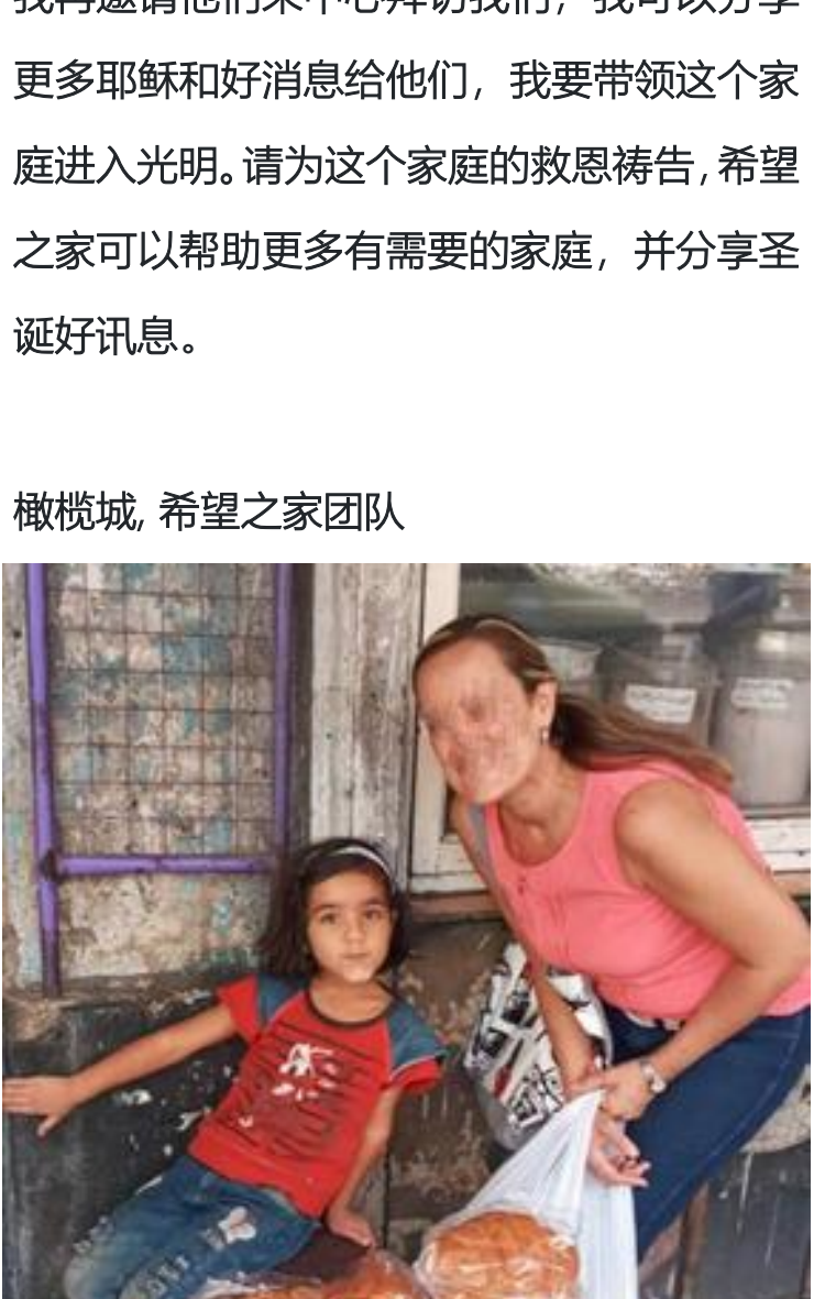
让小孩子到耶稣的跟前

亚美尼亚寄宿学校过去在圣诞节帮助很多贫苦儿童欢度圣诞。因为经济困难考虑今年停止活动。然而我们拥抱这个机会，分享神的爱，我们将会向他们分发圣诞礼物和圣诞食物包，共沐主恩，让小孩子到耶稣的跟前。