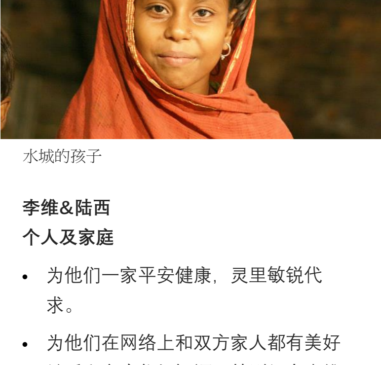
椰子城恩惠中心的孩子