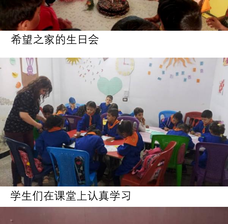
桥梁中心的学生和老师