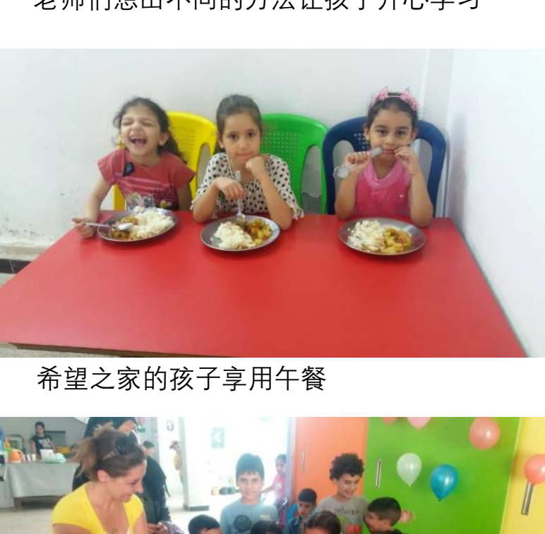
桥梁中心的学生正享用午餐