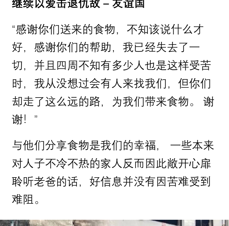
贾兰瓦拉 - 被纵火的老爸的家严重焚毁。

如果知道借出去的钱，对方一定会还钱，我们就会很乐意的借钱给朋友。老爸才是真正的「借贷者」。他为了贫穷人的需要，向我们「借贷」，让有需要的人得着帮助。老爸是「信实」的，未必是「金钱」的回报，可能是生命的改变。「阿爸父必偿还」他不欠债，偿还能力十足、准时的。没有人因遵行他的吩咐，帮助人，结果自己反而贫穷。亲爱的，以帮助别人来借给阿爸父！