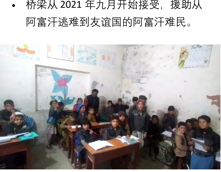
桥梁支持在友谊国的阿富汗难民小朋友读书和食物包