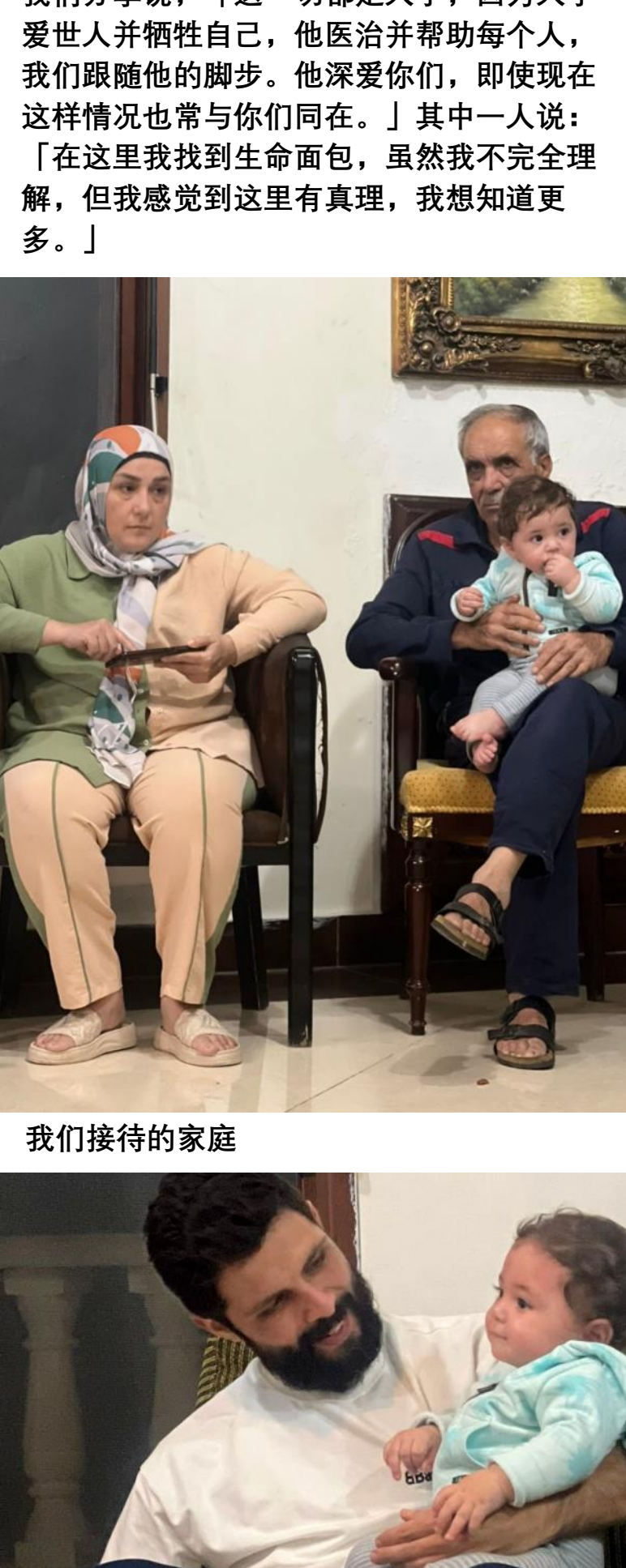
中国短访队的关爱与医治