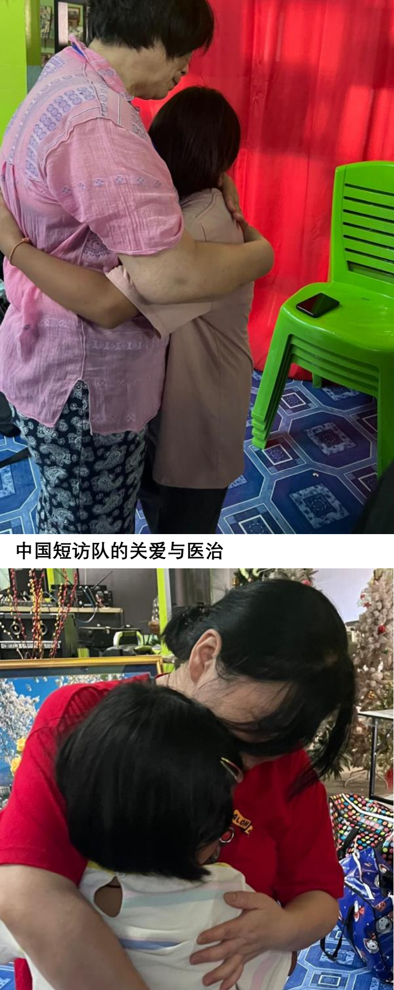
英国和台湾牧人的关怀和举手

桥梁海外工人，小泰和安迪弟兄得到短访队的英国和台湾牧人关怀和举手，第一次我看见小泰流泪了，他们面对服侍的巨大压力仍然忠心服侍人子。