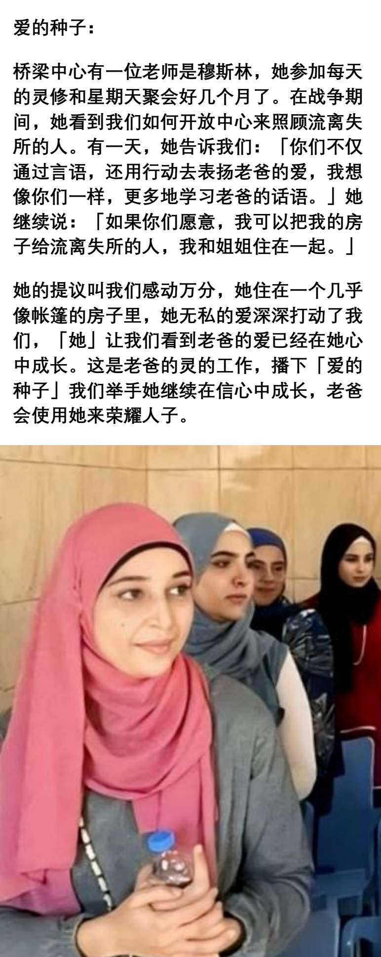
中国短访队的关爱与医治